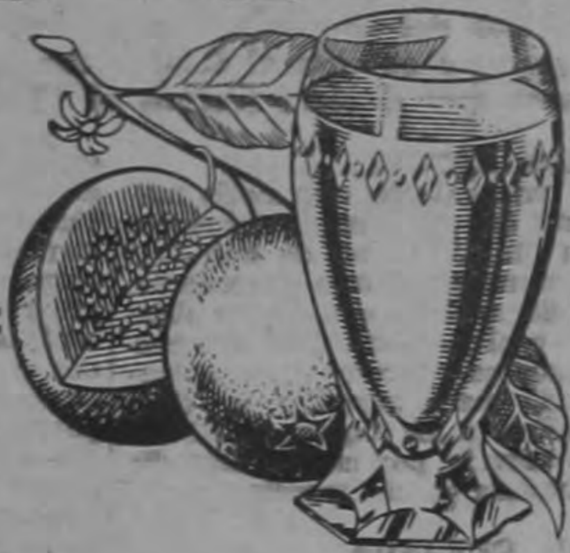
Néctar de Guayaba