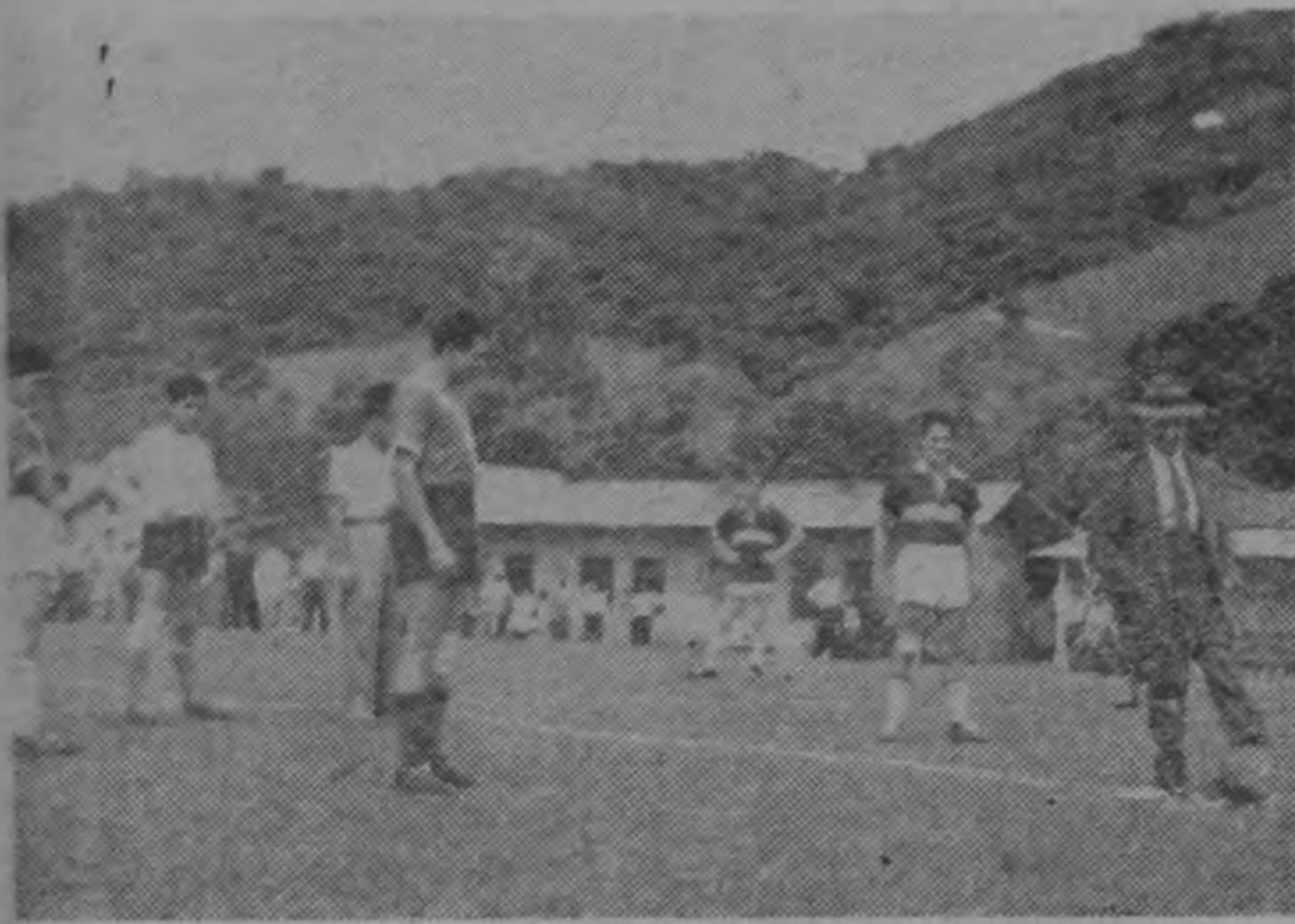
Don José Figueres hace el saque inicial, en el partido de balompié que le fuera dedicado el domingo en Patarró.