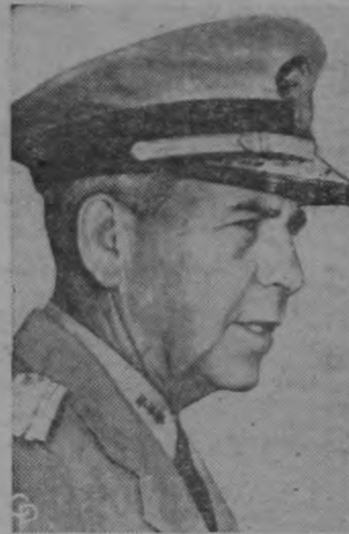
Adm. C. Turner Joy