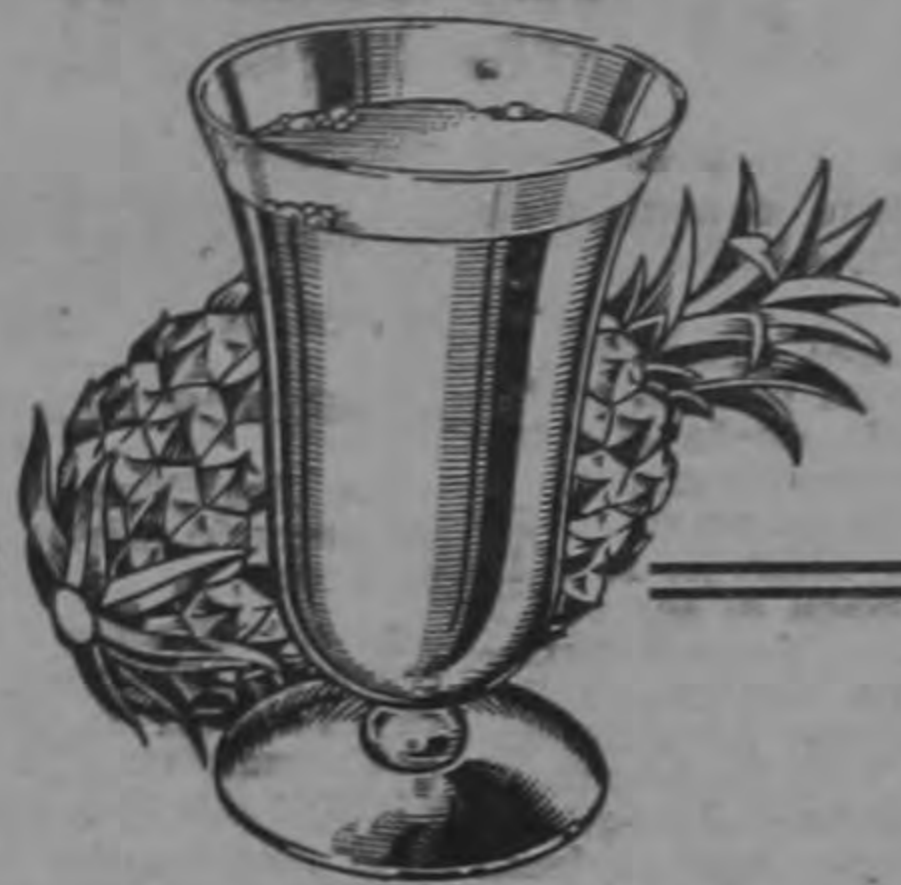
Jugo de Piña