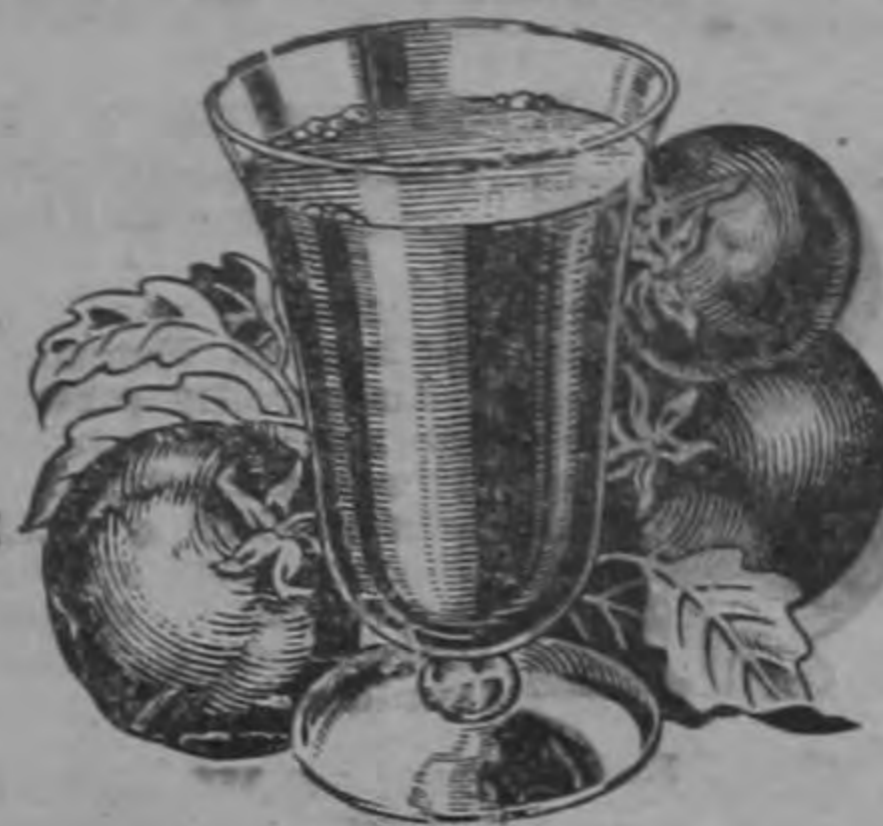
Jugo de Tomate