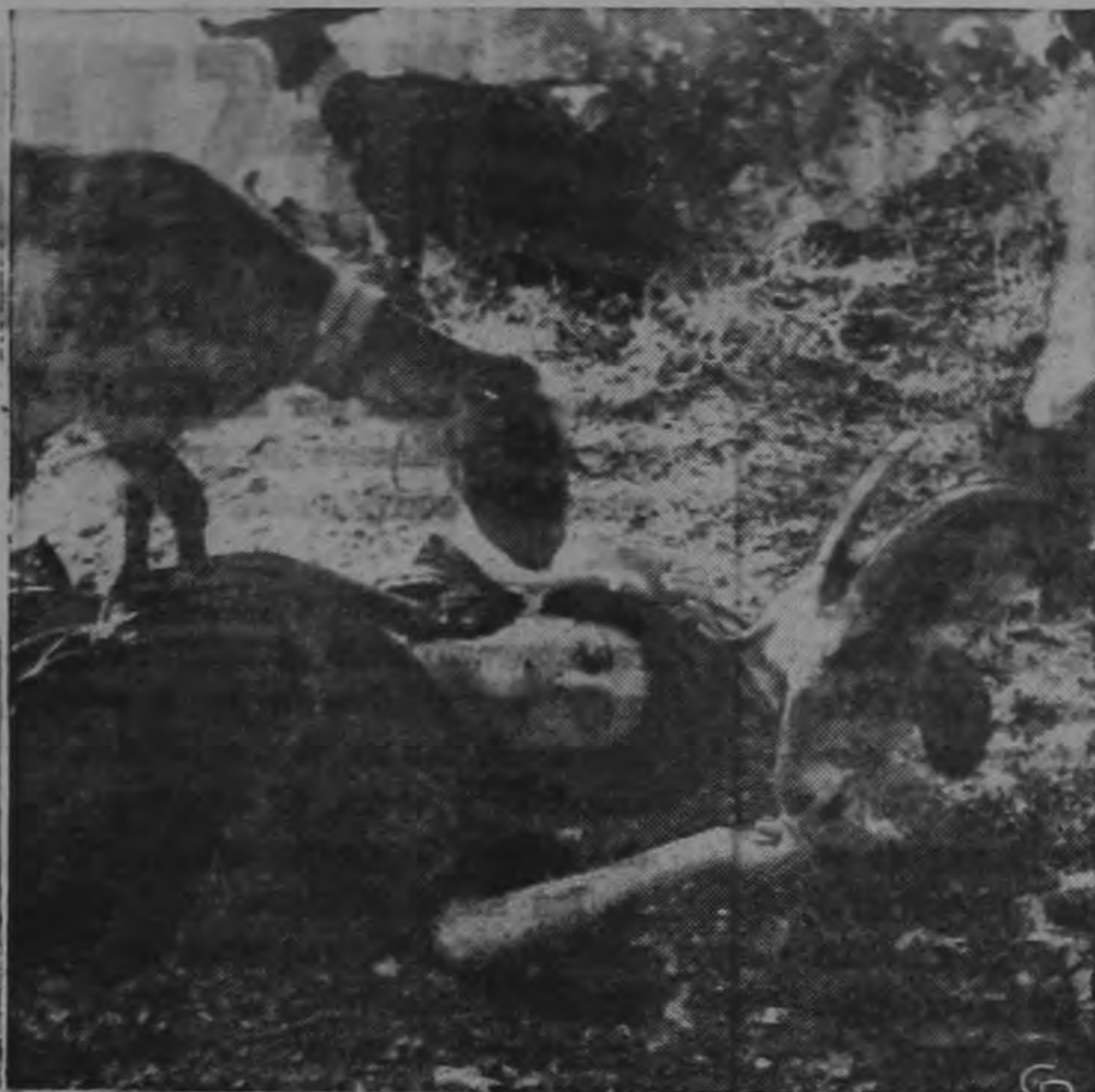
Anna Magnani en una escena de la discutida película "El Milagro"

El Juez William O. Douglas ha comentado que las películas "al