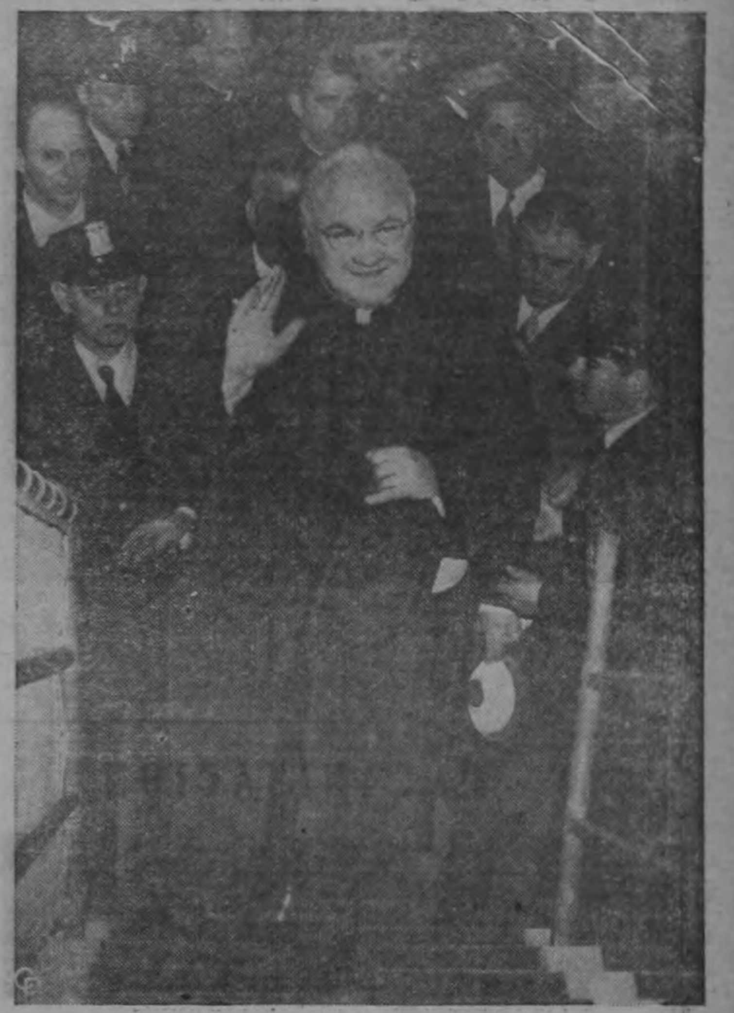
El Cardenal Francis Spellman, Arzobispo de Nueva York, toma en la ciudad de Nueva York el transatlántico "Constitution" en viaje a Barcelona, España, donde asistirá al Congreso Eucarístico Internacional. Más de 600 personas de 30 estados norteamericanos, del Canadá y de Centro América viajan a bordo del mismo barco con el propósito de asistir al Congreso que comenzará el 27 de Mayo y terminará el primero de junio.